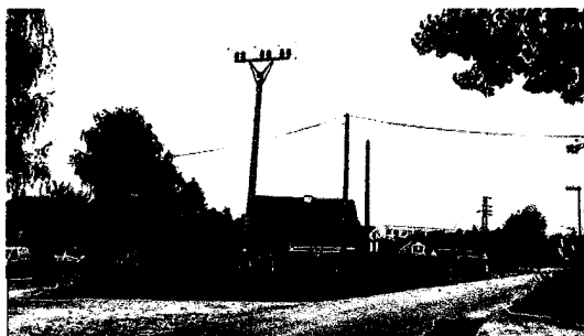
Obr.3: Úsek VN 234 nad odpredanými parcelami