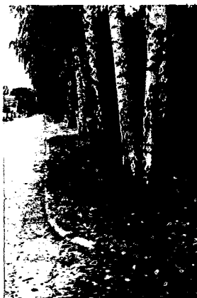
Obr.1: Zelený pás na Gučmanovej ulici